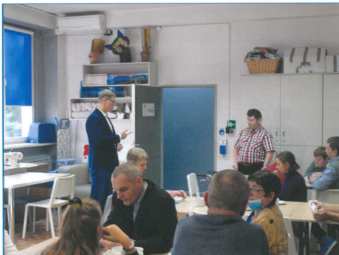
DZIEŃ OSÓB Z NIEPEŁNOSPRAWNOŚCIAMI