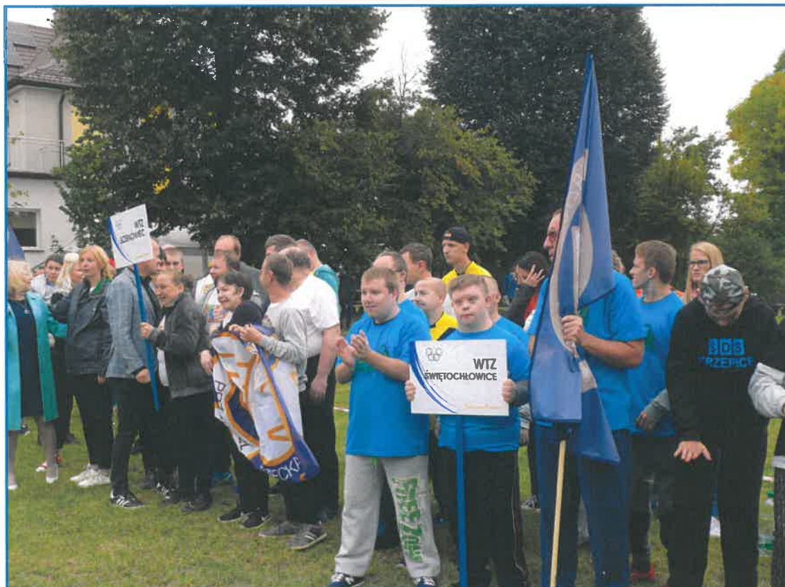
OLIMPIADA „SPEŁNIAMY MARZENIA”