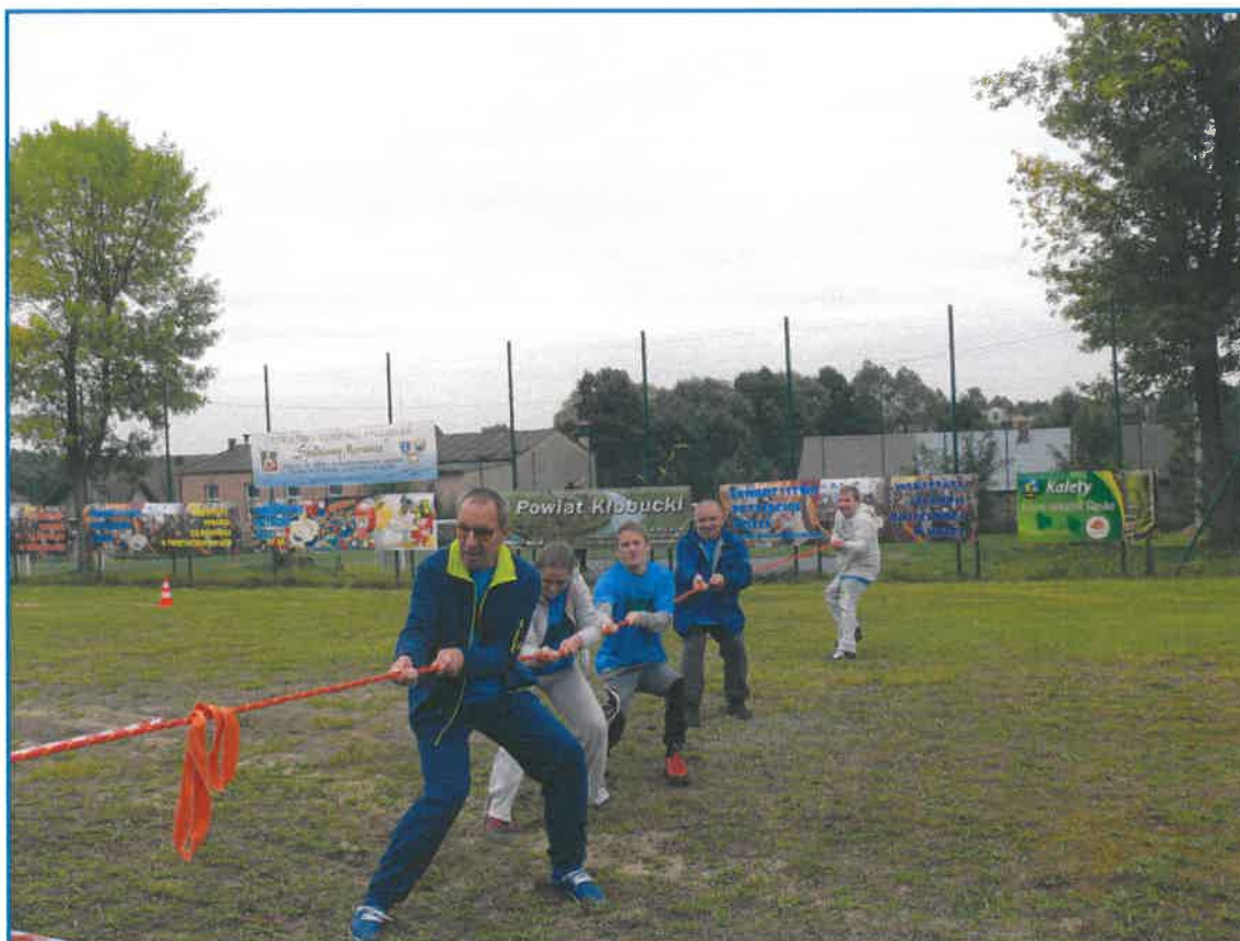
OLIMPIADA „SPEŁNIAMY MARZENIA”