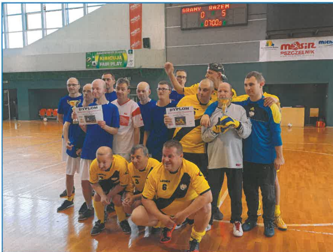
TURNIEJ GRAMY RAZEM